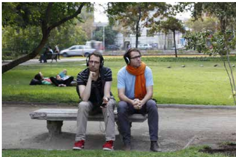
Figura 3. Imagen de audio recorrido, Parque Balmaceda, pleno centro de Santiago