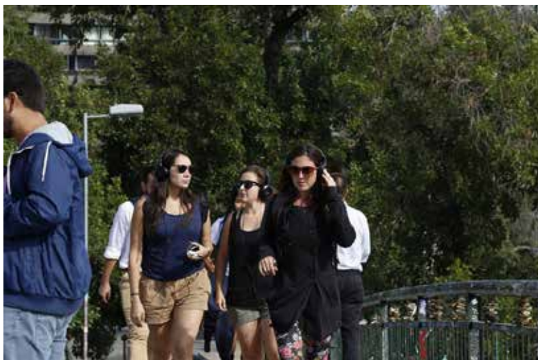
Figura 2. Imagen de audio recorrido. Las usuarias escuchan relato activado sobre el Puente del Arzobispo que pasa sobre el río Mapocho en Santiago