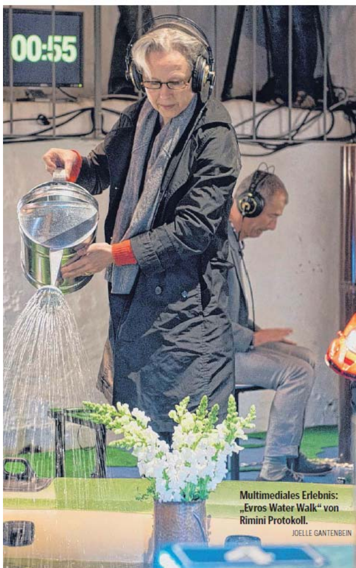
Multimediales Erlebnis: „Evros Water Walk“ von Rimini Protokoll.